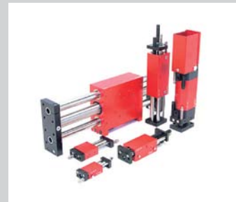
4 LM Linearmodule Große Hubauswahl, alle Positionen gedämpft, Zwischenposition möglich.