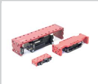
5 Compact- und Präzisionsschlitten Integrierte Stoßdämpfer, hohe Belastungen, präzise Positionierung, hohe Steifigkeit.