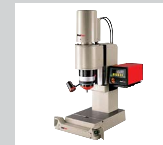
30 Standardradialnietmaschinen RN/RNE Zur Vernietung von Nieten Ø 1 mm bis Ø 30 mm, Kräfte bis 100 kN, mit Prozessüberwachung (Kraft - Weg) und Überstands-messung mit patentierter Autokompensation bei unregelmäßigen Überständen der Niete.