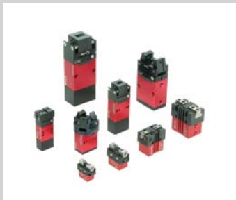
8 Greifer Verschiedenste Ausführungen, hohe Beanspruchung, geringes Gewicht, voll integrierbar im Afag Baukastensystem, bis zu 5 Positionen am Greifer überwachbar.