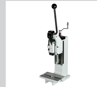
19 Handkniehebelpressen HKP Von 2,5 kN bis 50 kN, vergrößerte Einbauhöhe und Ausladungsvergrößerung möglich. Sehr präzise und spielfrei einstellbare Prismenführung.