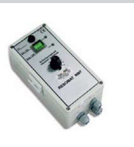
13 Regel- und frequenzgesteuerte Regelgeräte