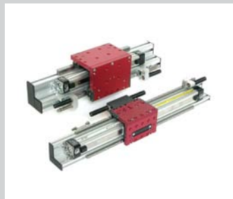
9 PMP Pneumatische Achsen Hohe Verwindungssteifigkeit, beliebige Zwischenpositionen, frei wählbare Hublängen, einfache Steuerung.