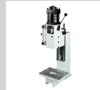
20 Handkniehebelpressen HKP/L mit Luftunterstützung Von 4 kN bis 56 kN, ohne elektrischer Sicherheitseinrichtung, laut Baumusterprüfung geeignet für Handarbeitsplätze.