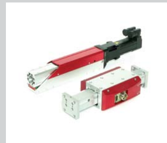
1 LME Linearmodul und SA Spindelausleger Frei programmierbar, einheitliche Bediensoftware, hohe Dynamik, hohe Nutzlasten, verschiedenste Hübe.