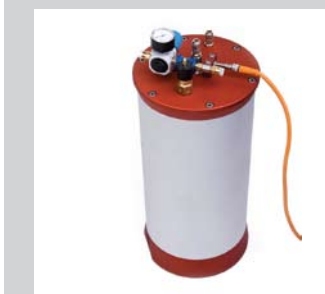
36 Vorratsbehälter RES-PNP/PNB Für die Produktaufbereitung (Entgasung, Option) und für die Bevorratung der zu dosierenden Medien. Ausführung von 1,25 l bis 2,5 l mit Kolben oder wahlweise Flasche.