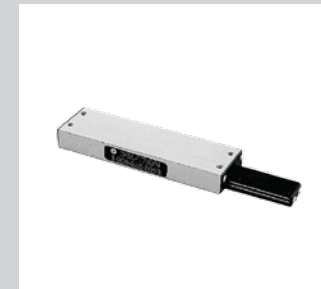
16 Präzisions-Linear-Kugel- und Kreuzrollführungen Hoch belastbar.