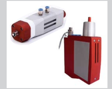
35 Zeit-Druck Membranventil DHH-MB und Volumetrisches Ventil VDH Membranventil geeignet für tiefviskose bis mittelviskose Medien. Alle mit dem Produkt in Kontakt tretenden Stellen sind aus Teflon (für aggressive Medien), Mengen von 1 bis 500 mm 3 . Volumetrisches Ventil geeignet für tief- und hochviskose Medien. Einstellb. Dosiervolumen von 0,5 bis 575 mm 3 .