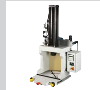
23 Hydropneumatische Portalpressen Von 100 kN bis 500 kN, andere Arbeits- und Krafthublängen, andere Baumaße und Sonderwünsche möglich. Pressensteuerung elektrisch in verschiedenen Varianten.