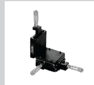
15 Linearpositioniertisch Ein- oder mehrachsrig, verstellbar mit Micrometerschrauben.