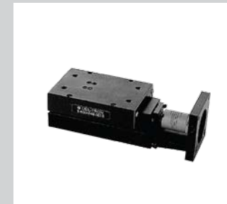
17 Posi - Drives Führungsschlitten mit Anbindung an z. B.: Servomotor.