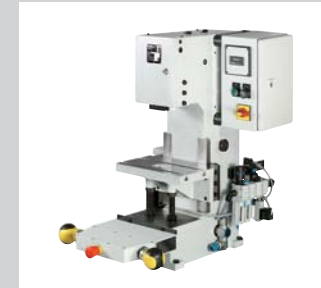
22 Pneumatische Kniehebelpressen KH Von 20 kN bis 100 kN, vergrößerte Einbauhöhe möglich, sehr präzise und spielfrei einstellbare Prismenführung. Pressensteuerung elektrisch, Baumuster geprüft mit 2 Handauslösung.