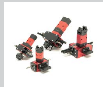
7 Greif - Drehmodul Verschiedenste Kombinationen von Greifern und Drehmodulen.