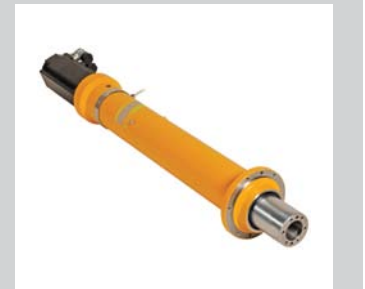
26 Fugemodul BASIC Von 10 kN bis 50 kN. Für einfache Verbindungs- und Umformaufgaben, klare und einfache Bedienung ohne PC mit Programmierdisplay. In reduzierter Ausführung zu einem attraktiven Preis.