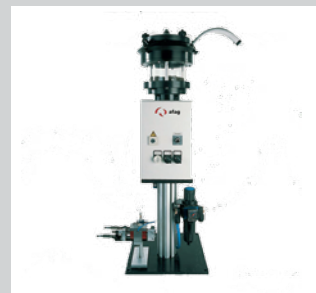
14 Individuelle und standardisierte Federentwirrsysteme