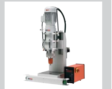
32 Smartline und Ecoline Die Radial- und Taumelnietmaschinen in reduzierter Ausführung zu einem attraktiven Preis in bekannter Baltec Qualität. Zur Vernietung von Niete Ø 1 mm bis Ø 12 mm, Kräfte bis 17 kN.