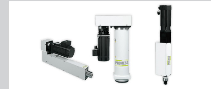
24/25 Universelle, kompakte und Präzisionsfügemodule Von 0,2 kN bis 500 kN. Präzises und flexibles Pressen, Fügen und Umformen für ein breites Anwendungsgebiet. Integrierte Kraft- Weg-Überwachung zur optimalen Qualitätssicherung.