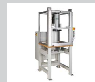
28 Servopressen Arbeitsplätze In verschiedensten Ausführungen möglich, auch Sonderausführungen.