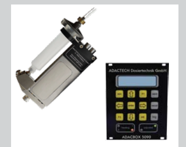
38 ADACSHOT-Serie 500 und Steuerung Geeignet für die Dosierung von Ölen, Fetten, Pasten, Sekundenklebern, Lacken oder UV-Klebstoffen. Heizbar bis 120° C. Kontaktlose Dosierung (bis zu 150 mm Abstand) einzelner mikrodosierter Tropfen. Bis zu 500 Dosierungen pro Sekunde. Abhängig von Medium und Menge. Mengen von 0,001 bis mehrere mm 3 .