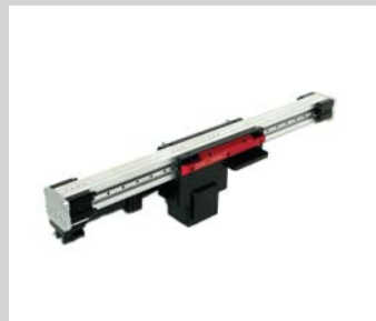
3 OZ OMEGA-Zahnriemensauger Hochstabil, steife Konstruktion, massive Doppelführung, kraftvoller Motor, dynamisch, fährt frei in den Arbeitsraum ein, mit Hüben bis 600 bzw. 1000 mm.