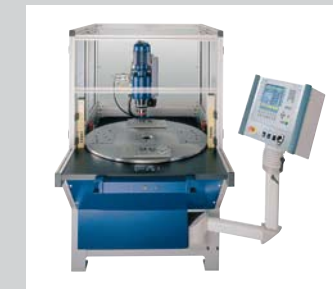
31 CNC High Speed Koordinaten Nietmaschine Optimale Visualisierung mit Touch Panel, schnelle und einfache Programmierung, flexibel und hohe Verfügbarkeit.