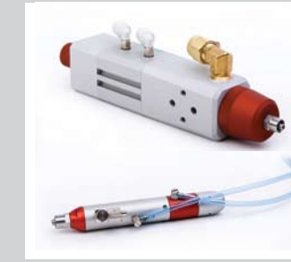
34 Zeit-Druckventile MDH-3 und DDH-3 Geeignet für die Dosierung von tiefviskosen bis hochviskosen Medien. Mengen von 1 bis 100 mm 3 und von 1 bis 500 mm 3 . Extrem kurze Dosierzeiten. Kontrollierte Dosierbewegung durch Endlagenüberwachung. Integrierte Dichtigkeitsüberwachung des Dosiergerätes.