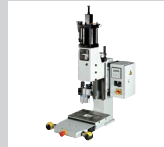
21 Linearwirkende Pneumatikpressen LP Von 4 kN bis 56 kN, vergrößerte Einbauhöhe und Ausladungsvergrößerung möglich. Sehr präzise und spielfrei einstellbare Prismenführung. Pressensteuerung elektrisch, Baumuster geprüft mit 2 Handauslösung.