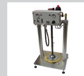
37 Faßpumpen BP-PN Hochdruckfaßpumpen von 1 bis 200 Liter in verschiedenen Ausführungen. Mögliche Optionen sind Druckreduzierer, Füllstandskontrollen und andere steuerungsrelevante Bausteine.