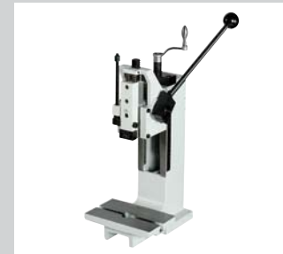
18 Zahnstangenpressen HZP 2 kN und 4 kN, vergrößerte Einbauhöhe und Ausladungsvergrößerung möglich.