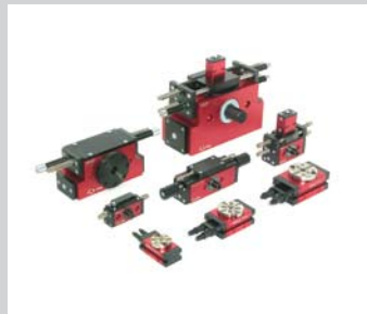
6 CR und RM Rotationsmodule In Kompakt- oder Standardbauform, verschiedene Wellenabgänge, 0 bis 360° Drehwinkel, Zwischenpositionen möglich, 0,45 bis 27,5 Nm.