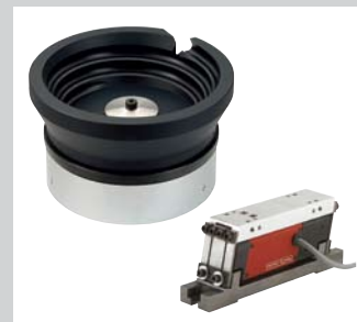
12 Rundförder- und Linearförderantriebe mit individuellen Rohlingen