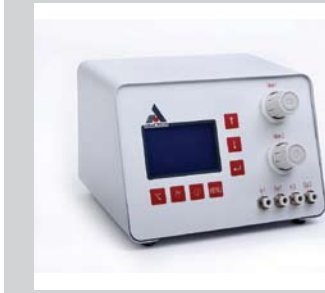
33 Steuergeräte ADACBOX Für die Verwaltung und Programmierung von Dosierprozessen für Zeit-Druck- und Volumetrischen Ventilen. Optionen wie Fußschalter, Handauslöser sind für die Geräte verfügbar.