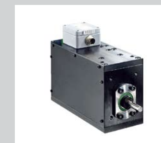
27 Drehmomentmodul Verbindet die NC-gesteuerte Drehbewegung mit der Überwachung von Drehmoment-Drehwinkelverläufen. Mit diesen Einheiten können Winkelpositionen präzise gesteuert, Lastenmomente exakt aufgebracht und Prozessdaten einfach erfasst werden.