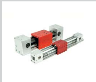
2 PME und PME compact Portalmodule Für hohe bis mittlere Belastungen, frei positionierbar, hohe Verwindungssteifigkeit, Doppelführung, kraftvoller Motor, dynamisch, fährt frei in den Arbeitsraum ein, mit Hüben bis 600 bzw. 1000 mm.